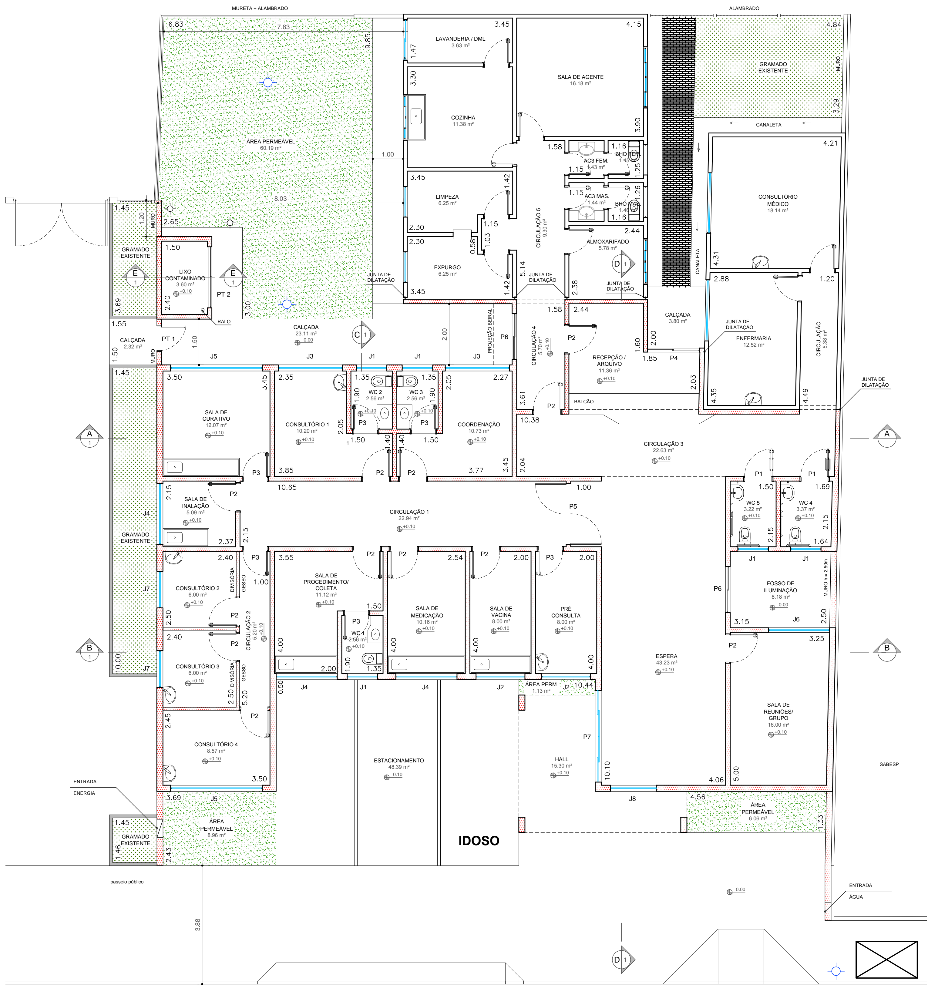
PLANTA BAIXA ESC.: 1:75