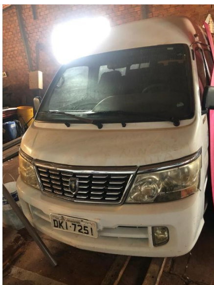
Item 39: VEICULO TOPIC