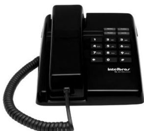
Item 33:TELEFONE C/ FIO PRETO