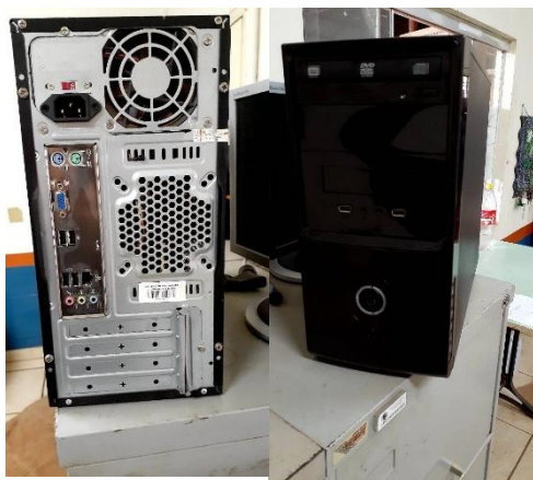
ITEM 17: GABINETE P/ COMPUTADOR.