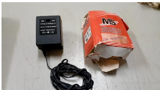
Item 28: FONTE DE ALIMENTAÇÃO 110/220V.