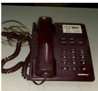
Item 34: TELEFONE C/ FIO NA COR VINHO