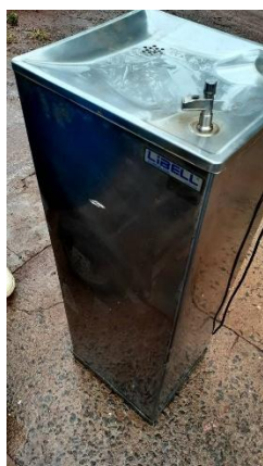
ITEM 25: PURIFICADOR DE ÁGUA 95 cm.