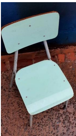
ITEM 8: CADEIRA ESCOLAR INFANTIL NA COR AZUL CLARA ( DE 1 Á 5 ANOS).