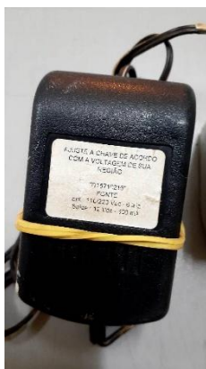
tem 29: PONTO ELETRÔNICO DE CARTÃO.