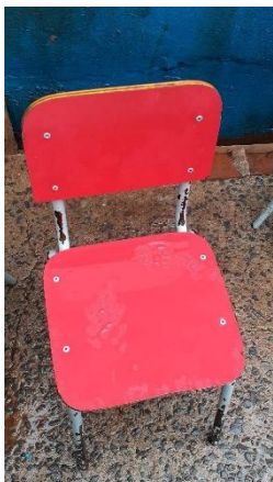
ITEM 7: CADEIRA ESCOLAR INFANTIL NA COR VERMELHA ( DE 1 Á 5 ANOS).