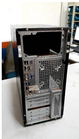
ITEM 19: GABINETE P/ COMPUTADOR.