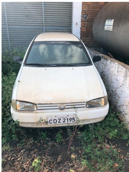
Item 41: VEÍCULO PARATI