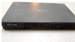
ITEM 13: MODEM RÓTERADOR TL-R470T+.