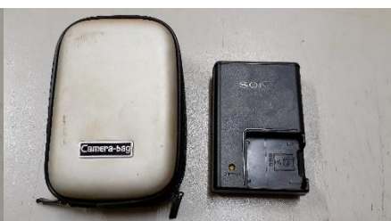
Item 30: CARREGADOR DE BATERIA P/ MAQUINA DE FOTOS DIGITAL.