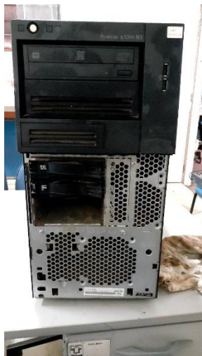
ITEM 21: SERVIDOR SYSTEM X3200 M3.