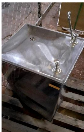
ITEM 1: PURIFICADOR DE PRESSÃO DE INOX PARA USO EXTERNO 95CM.