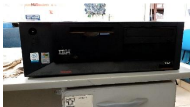
ITEM 20: GABINETE P/ COMPUTADOR.