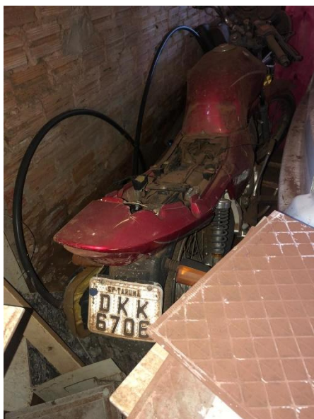
Item 40: MOTOCICLETA KASINSKI