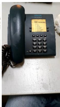
Item 27: TELEFONE C/ FIO PRETO.