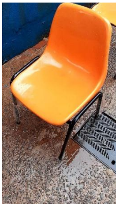
ITEM 5: CADEIRA DE PLÁSTICO TIPO CONCHA NA COR LARANJA.