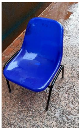
ITEM 4: CADEIRA DE PLÁSTICO TIPO CONCHA NA COR AZUL.