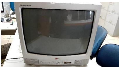
Item 35: TELEVISOR 20 POLEGADAS MODELO RP20CB20A