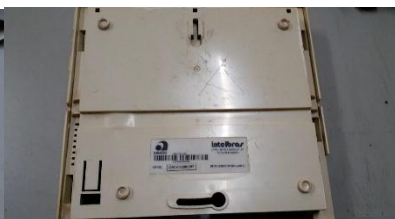
Item 32: MÓDULAREI SERIE CEO410280067