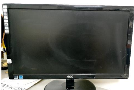
ITEM 23: MONITOR 20 POLEGADAS.