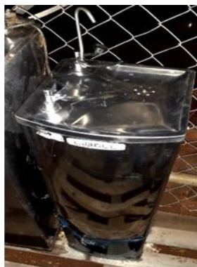
ITEM 3: PURIFICADOR DE PRESSÃO BABY INOX 127V 85 CM.