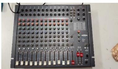
ITEM 11: PAINEL DE SOM (MESA DE SOM PROFISSIONAL).