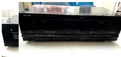
ITEM 14: APARELHO RECEPTOR USR-1900.