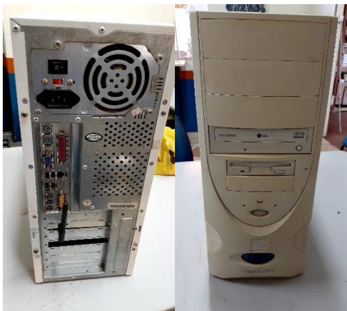
ITEM 18: GABINETE P/ COMPUTADOR.