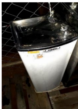
ITEM 2: PURIFICADOR DE PRESSÃO BABY BRANCO 220V 85CM.