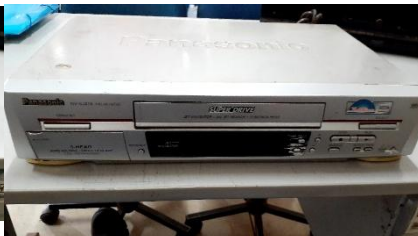
ITEM 16: APARELHO DE VIDEO-CASSETE NV- SJ415.