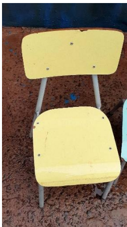
ITEM 9: CADEIRA ESCOLAR INFANTIL NA COR AMARELO ( DE 1 Á 5 ANOS).