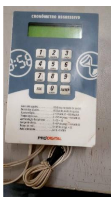
Item 26: CRONÔMETRO REGRESSIVO.