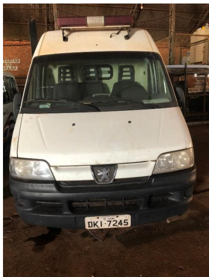
Item 42: VEÍCULO AMBULANCIA