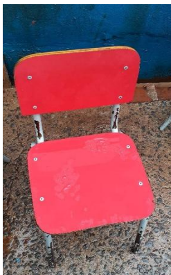
ITEM 20: CADEIRA ESCOLAR INFANTIL NA COR VERMELHA ( DE 1 Á 5 ANOS).