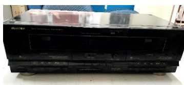
ITEM 28: STEREO DOUBLE CASSETTE DECK DC-8088.