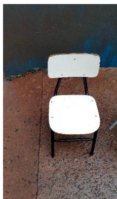
ITEM 19: CADEIRA ESCOLAR INFANTIL NA COR BRANCA ( DE 1 Á 5 ANOS).