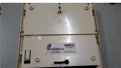
Item 45: MÓDULAREI SERIE CEO410280067