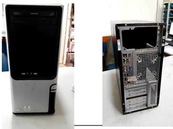
ITEM 32: GABINETE P/ COMPUTADOR.