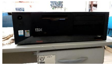
ITEM 33: GABINETE P/ COMPUTADOR.