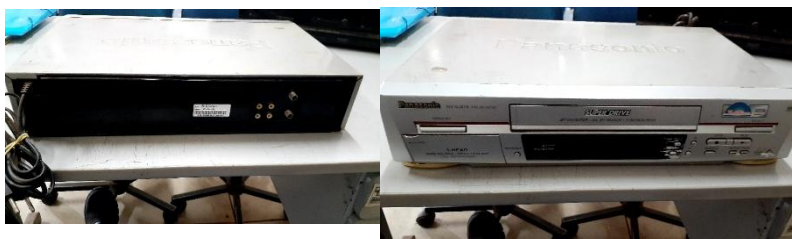
ITEM 29: APARELHO DE VIDEO-CASSETTE NV-SJ415.