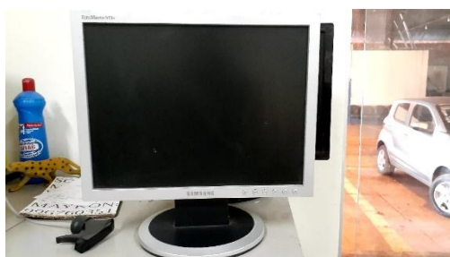
ITEM 35: MONITOR 15 POLEGADAS