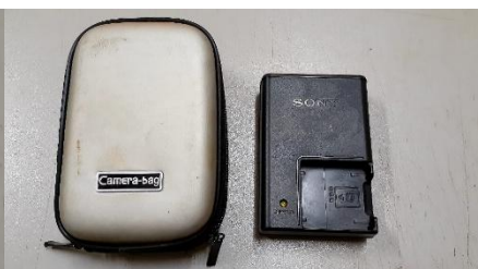
Item 43: CARREGADOR DE BATERIA P/ MAQUINA DE FOTOS DIGITAL.