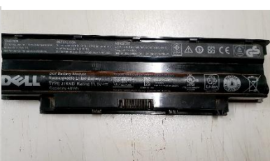
Item 44: BATERIA P/ NOTBOOK