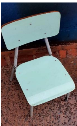
ITEM 21: CADEIRA ESCOLAR INFANTIL NA COR AZUL CLARA ( DE 1 Á 5 ANOS).