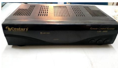
ITEM 27: APARELHO RECEPTOR USR-1900.