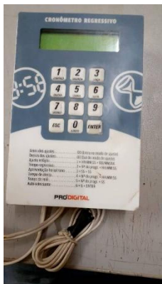
Item 39: CRONÔMETRO REGRESSIVO.