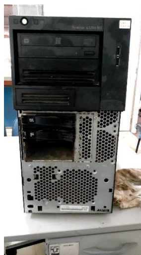
ITEM 34: SERVIDOR SYSTEM X3200 M3.