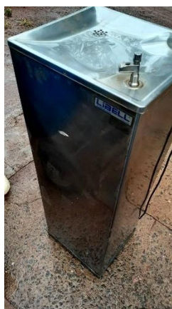
ITEM 38: PURIFICADOR DE ÁGUA 95 cm.