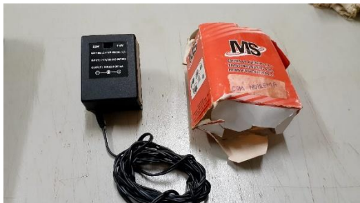
Item 41: FONTE DE ALIMENTAÇÃO 110/220V.