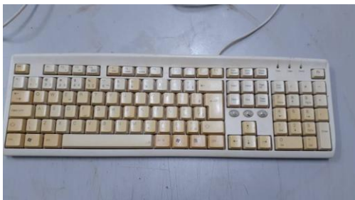
ITEM 37: TECLADO P/ COMPUTADOR