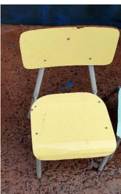
ITEM 22: CADEIRA ESCOLAR INFANTIL NA COR AMARELO ( DE 1 Á 5 ANOS).