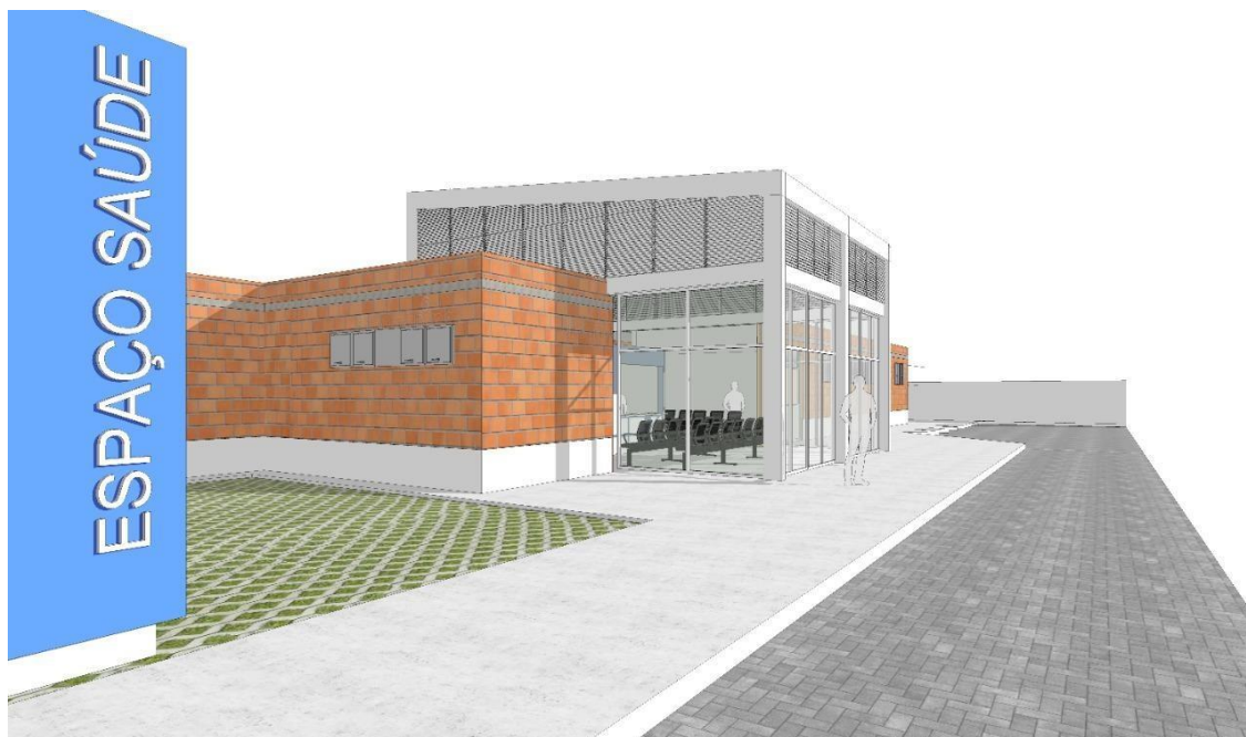
figura02 – Perspectiva