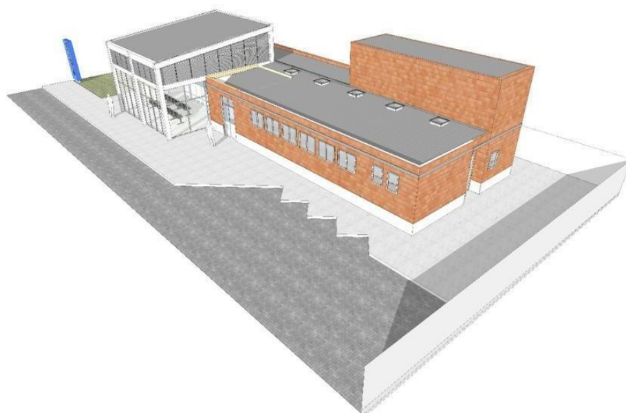
figura03 – Perspectiva