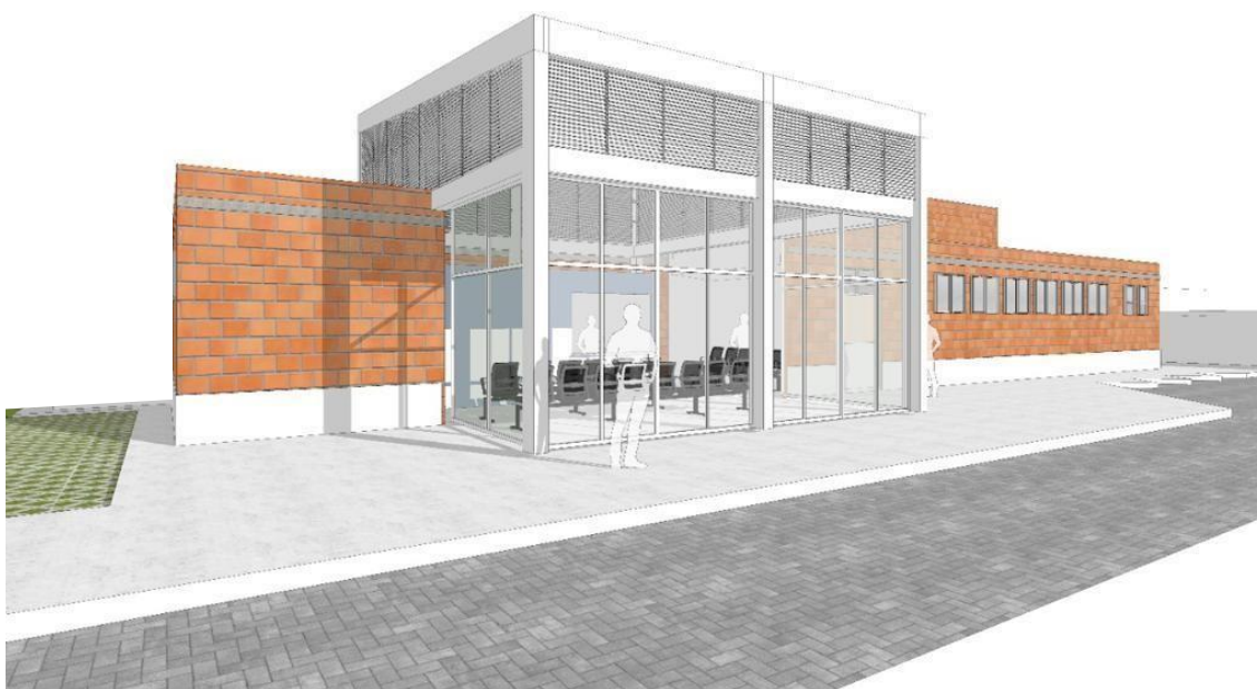
figura04 – Perspectiva