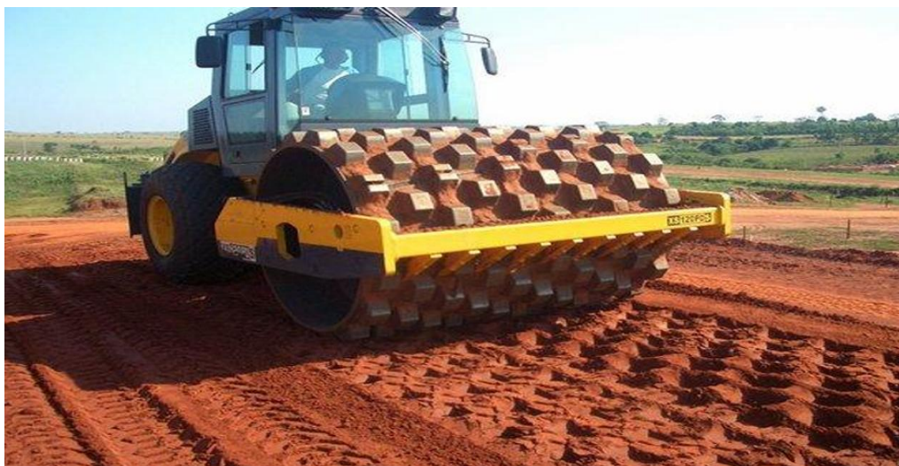
*FOTO 3 - MODELO DE REFERÊNCIA PARA ILUSTRAÇÃO: ROLO COMPACTADOR “PÉ DE CABRA”

1.1.2.3.1. Rolo compactador tipo “pé de cabra”, destinado à execução de serviços de compactação de solos argilosos em camadas estruturais, especialmente em obras de terraplenagem, pavimentação e conformação de base, devendo apresentar desempenho operacional compatível com atividades de infraestrutura urbana e rural.