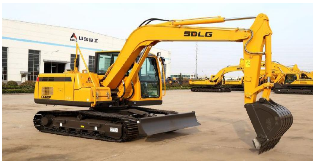
*FOTO 2 - MODELO DE REFERÊNCIA PARA ILUSTRAÇÃO: ESCAVADEIRA HIDRÁULICA

1.1.2.2.1. Escavadeira hidráulica destinada à execução de serviços de escavação de valas, drenagem, carregamento, desassoreamento e movimentação de materiais, devendo apresentar desempenho operacional compatível com atividades de infraestrutura urbana e rural.