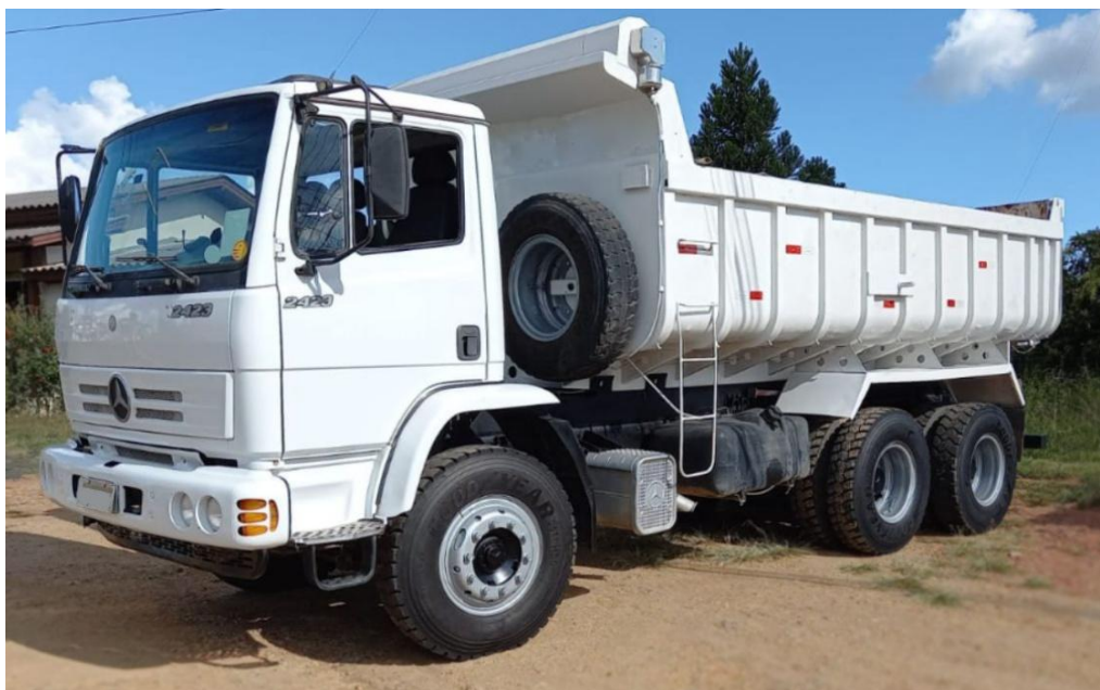
*FOTO 4 - MODELO DE REFERÊNCIA PARA ILUSTRAÇÃO: CAMINHÃO BASCULANTE

1.1.2.4.1. Caminhão basculante destinado ao transporte de terra, cascalho, brita, areia, entulhos, resíduos, materiais de construção, agregados e demais insumos necessários à execução de serviços de infraestrutura urbana e rural, manutenção de vias públicas, estradas vicinais, obras de drenagem, limpeza de áreas públicas e apoio operacional às frentes de trabalho, devendo apresentar desempenho compatível com as demandas da Administração Municipal.